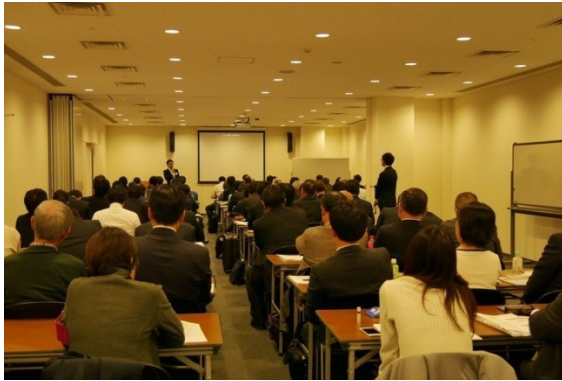
写真－2 活用事例報告状況