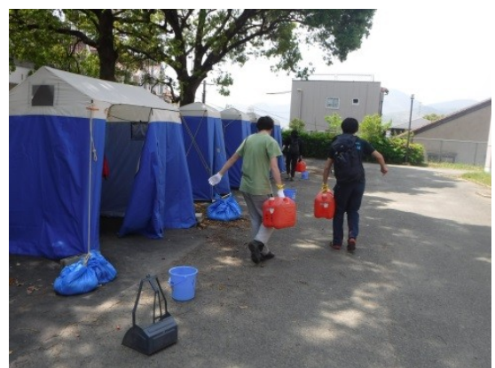
写真－1 マンホールトイレの活用状況