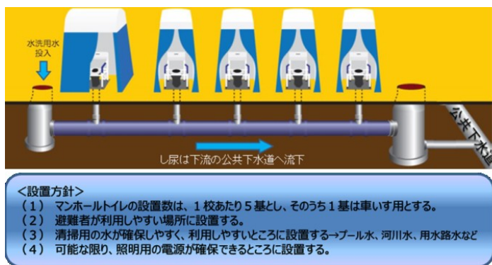
図－1 熊本市のマンホールトイレ構造

マンホールトイレ整備計画に基づき、平成 26 年度から市内中学校へのマンホールトイレの整備に着手しました。平成 29 年 2 月末現在で、13 校への整備が完了しています。（図－2）