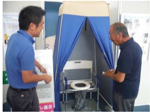
写真－3 イベント展示状況