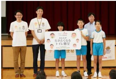
『みんなが行きたくなるトイレ』贈呈式