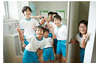
トイレ空間改善後②