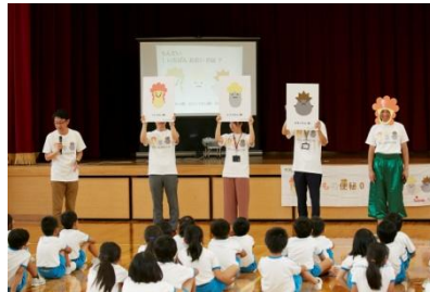
『おなかを元気にする授業』