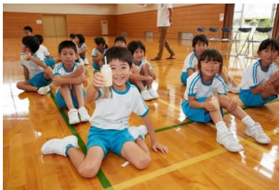
ラブレ菌を含む乳酸菌飲料の飲用