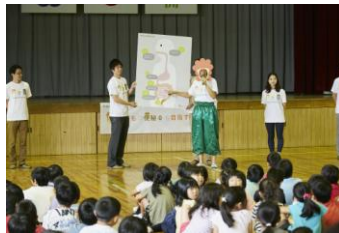
『おなかを元気にする授業』