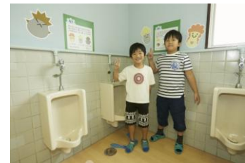
トイレ空間改善後