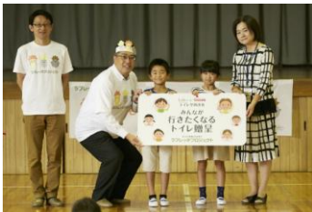
『みんなが行きたくなるトイレ』贈呈式