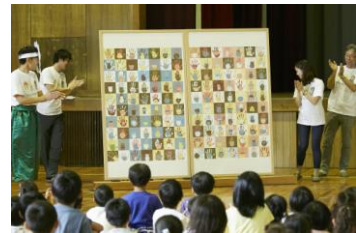
アートワーク発表