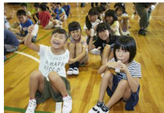
ラブレ菌を含む乳酸菌飲料の飲用