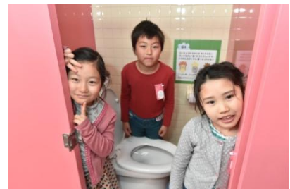
トイレ空間改善後② (床面の乾式化工事は4月24日(月)から実施)