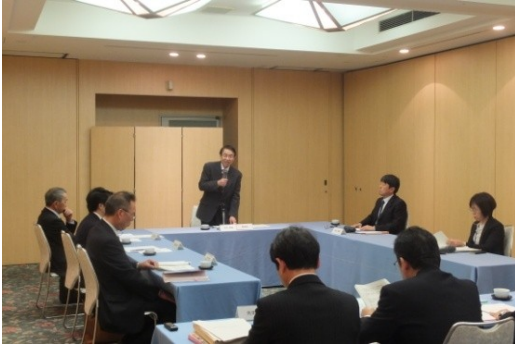
災害時快適トイレ計画策定検討委員会