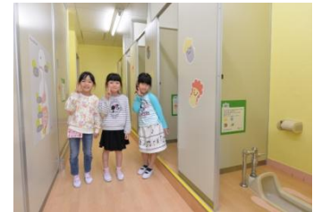
トイレ空間改善後②