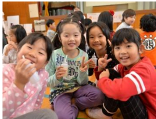
ラブレ菌を含む乳酸菌飲料の飲用