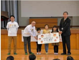
『みんなが行きたくなるトイレ』贈呈式