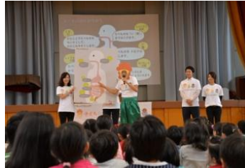
『おなかを元気にする授業』